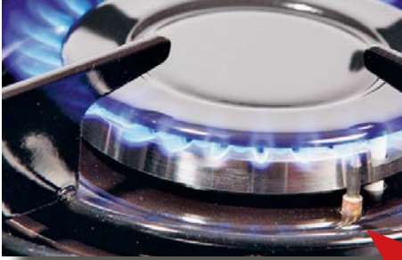
Alev sönme emniyeti bulunan gazlı ocak Resimdeki ok ocağın termokupluna işaret etmektedir

Alev sönme emniyeti olan gazlı ocakları yakarken, ayar düğmesinin 15 saniye boyunca basılı tutulması gerekir; emniyeti bulunmayan ocaklar ise hemen alev alır. Emniyeti bulunmayan ocakları, ayrıca alev başlığının yanında bir termokuplun (yaklaşık 1 santim uzunluğunda metal bir pim, soldaki resme bakınız), bulunmamasından tanımak mümkündür. Fırın bölmeleri ise daima alev sönme emniyeti ile donatılmış olur.