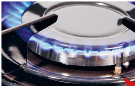
Fogão a gás com fusível de ignição A flecha vermelha aponta para o elemento térmico

É possível reconhecer fogões a gás quando o fogão não contém um elemento térmico (um pino de metal de aproximadamente 1 cm de comprimento, ver imagem à esquerda) ao lado do queimador e quando não é necessário pressionar o botão interruptor durante cerca de 15 segundos ao acender o fogo. O forno sempre possui fusível de ignição.